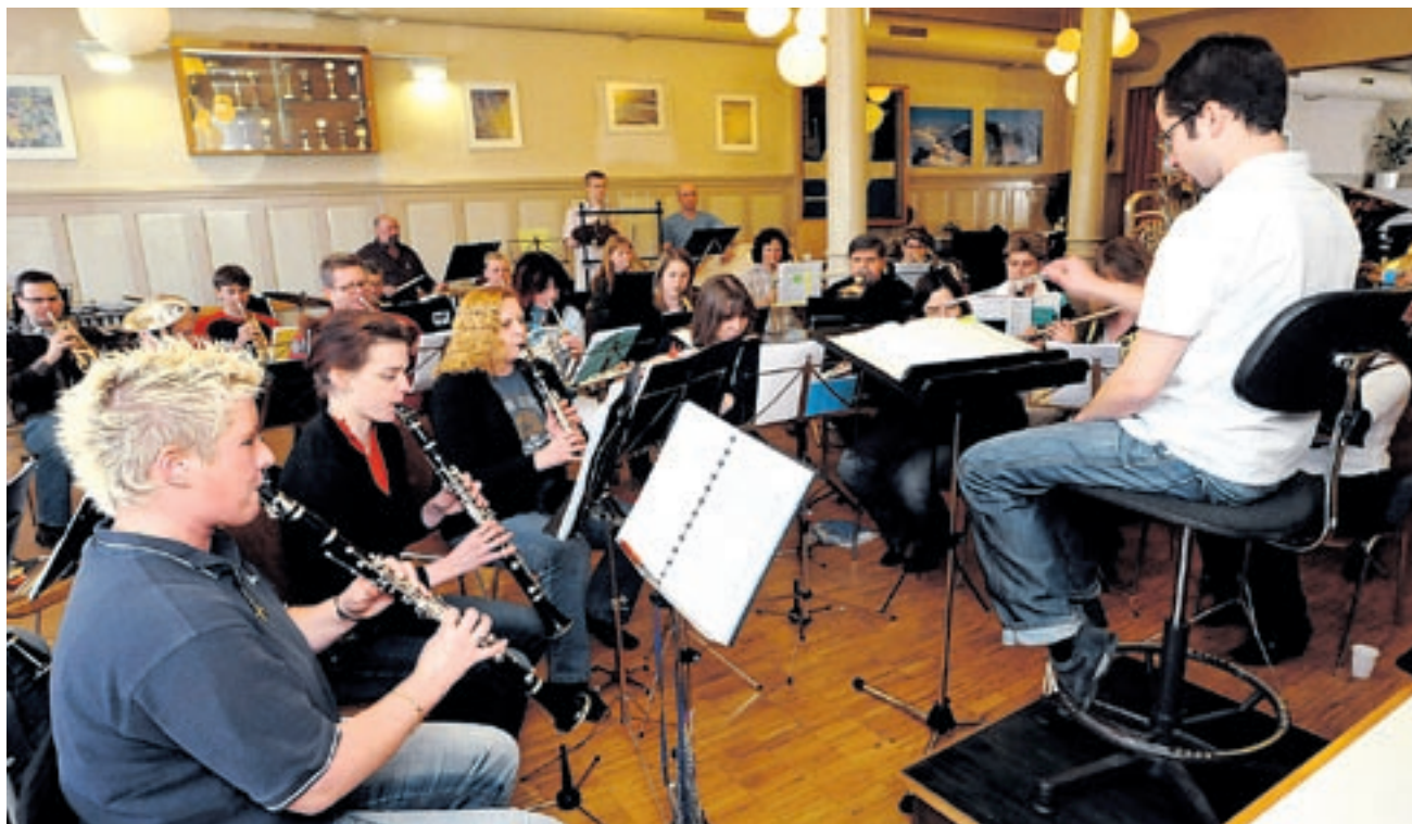
Proben intensiv für ihre Premiere am nächsten Samstag: die Musikerinnen und Musiker des Blasorchesters Winterthur.